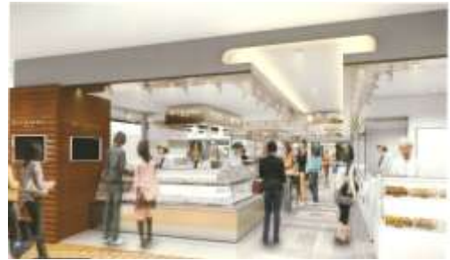
メインファサードイメージ