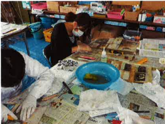
写真洗浄ボランティア活動の様子

現地NPO法人による指導のもと、ボランティア活動（写真洗浄）を実施いたしました。また、市沿岸部における被災地区の視察を行いました。