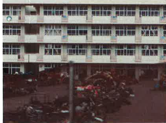
被災した小学校の校庭は、壊れたオートバイの置き場に