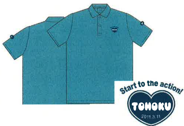
東北応援ポロシャツのデザイン

当社のスーパークールビズ実施にあわせて、仙台市内の事業者を訪問し、東北応援のデザインが施された東北応援「ポロシャツ」および「うちわ」の製作を依頼しました。