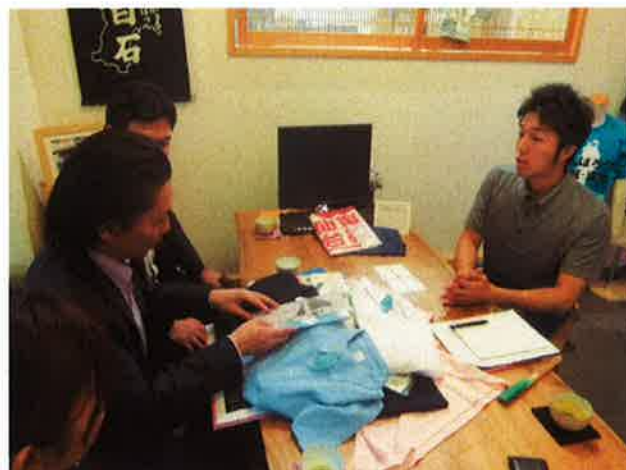
地元事業者との打ち合わせ