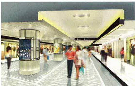
（中央通路イメージパース）

開業以来、メインストリートである中央通路の大規模なリニューアルは、はじめてとなります。年末に向けて、日々変貌を遂げる「横浜ポルタ」にどうぞご注目ください。