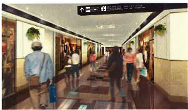
（ファッションゾーンイメージパース）